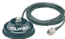
M-700K Suporte Magnético 4,0 m Cabo