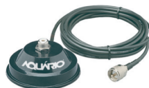
M-700K Suporte Magnético 4,0 m Cabo