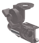
M-500 Suporte Calha Zamak